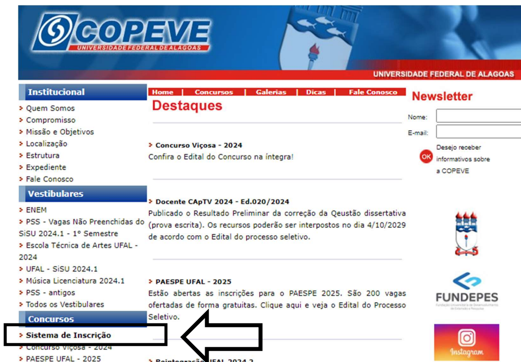
Figura 1 – Acessar Sistema de Inscrição.