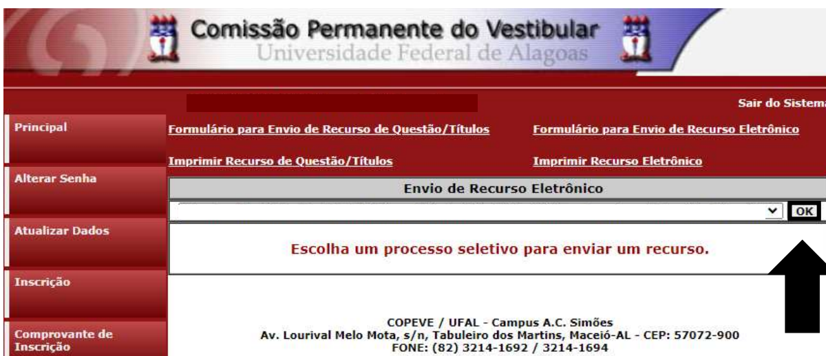
Figura 5 – Selecionar o certame.

6. Selecionar o Concurso Público “Técnico-Administrativo UFAL Efetivo – Edital n. 017.2024” e confirmar (Figura 5);